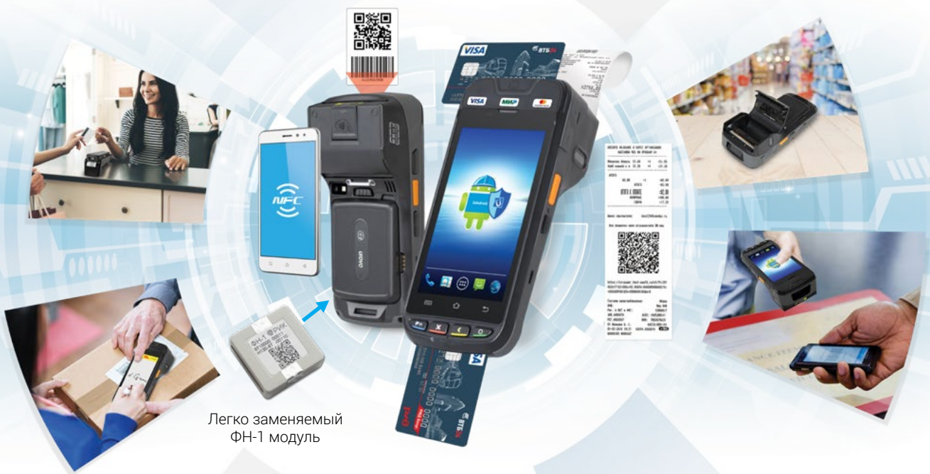
Легко заменяемый ФН-1 модуль