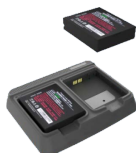
Зарядное устройство с двумя слотами